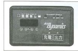
インバーター充電器