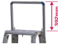
オプション手掛棒 (60・90・120用)