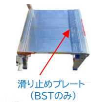
滑り止めプレート (BSTのみ)