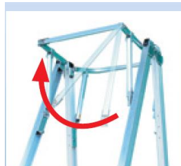
開閉式バーで天板への 出入りがスムーズ