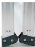
滑り止めキャップ