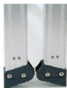
滑り止めキャップ