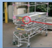
機番プレート取付位置