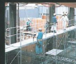
両サイドの枠組足場のパイプに ライトブリッジのフックを掛けて 安全通路が出来上がります。