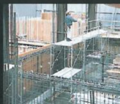
枠組足場で島を作る。