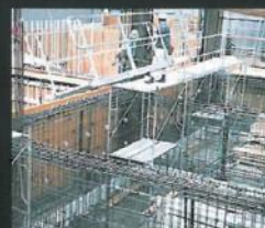
島と島の間にライトブリッジを レッカー（クレーン）で降ろす。