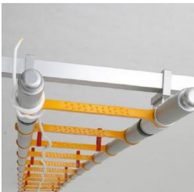
角パイプと吊金具