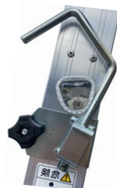
未使用時は折畳出来ます。