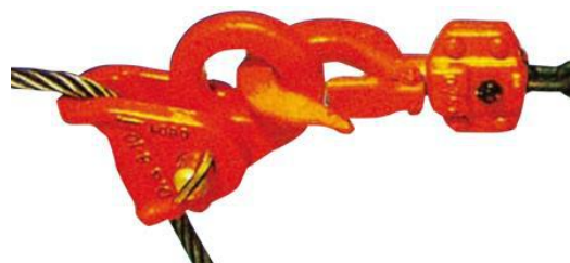
歪み直しワイヤー 規格寸法