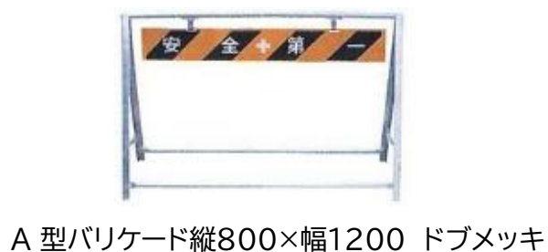
A型バリケード縦800×幅1200 ドブメッキ