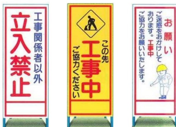
工事看板各種取扱っております。