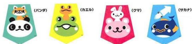
A ガードカバー縦400×幅330