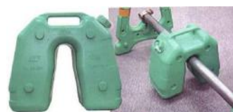
バリウエイト 注水時約10kg