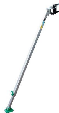
コンステージアウトリガー