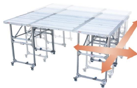
連結による高い拡張性 充実したオプションで色々な作業に対応