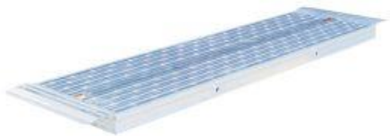
コンステージ連結ブリッジ MKTB-SML