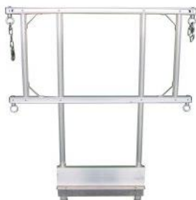
コンステージ補助手摺 MKTT-SML