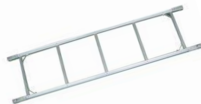
コンステージ連結補助手摺(ブリッジ部) MKTR-S MKTR-ML