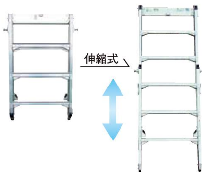
コンステージはしご MKTH-S MKTH-O MKTH-M MKTH-L