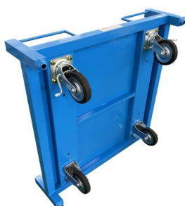
大型ゴムキャスター (自在式+固定式)