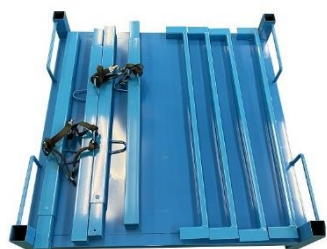
簡単に組立て分解ができます