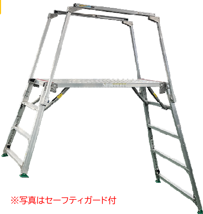
※写真はセーフティガード付