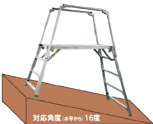
■傾斜地使用イメージ 対応角度は水平から16度